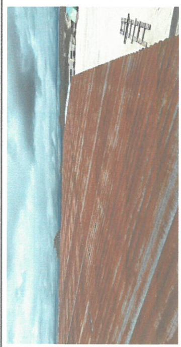
Foto 1: Es el cambio de láminas acanalada por lamina troquelada calibre 26 de aluzinc