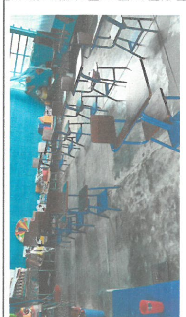
Foto 4: En este el aula se cambia el piso de cemento por piso granito.