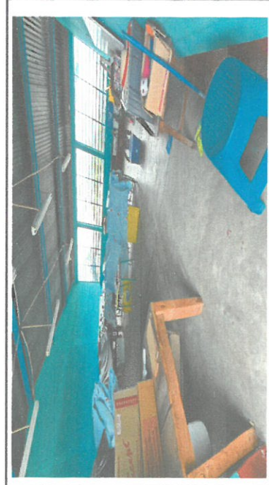
Foto 5: En este espacio se cambia el piso cemento por piso granito.