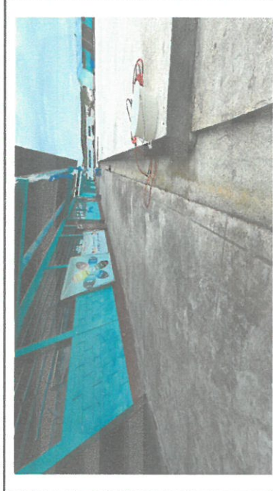
Foto 3: En este corredor se cambia el piso de cemento por piso de granito.