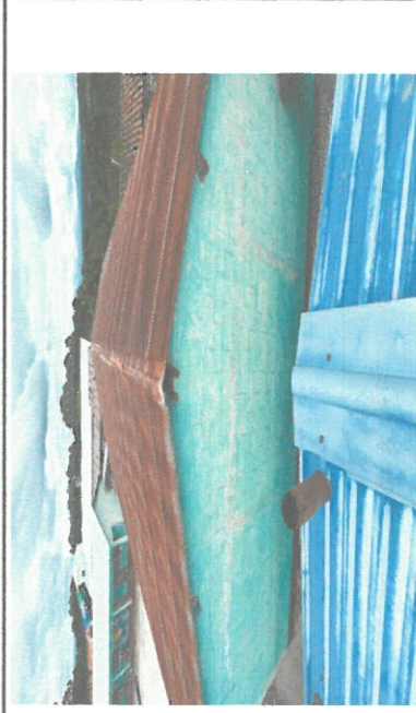
Foto 2: Es el cambio de láminas acanalada por lamina troquelada calibre 26 de aluzinc